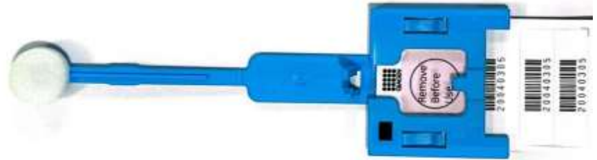
Swab oral para coleta de material genético da vítima.